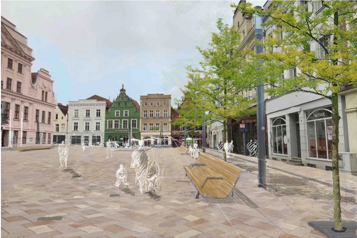
Bilder zum Projekt