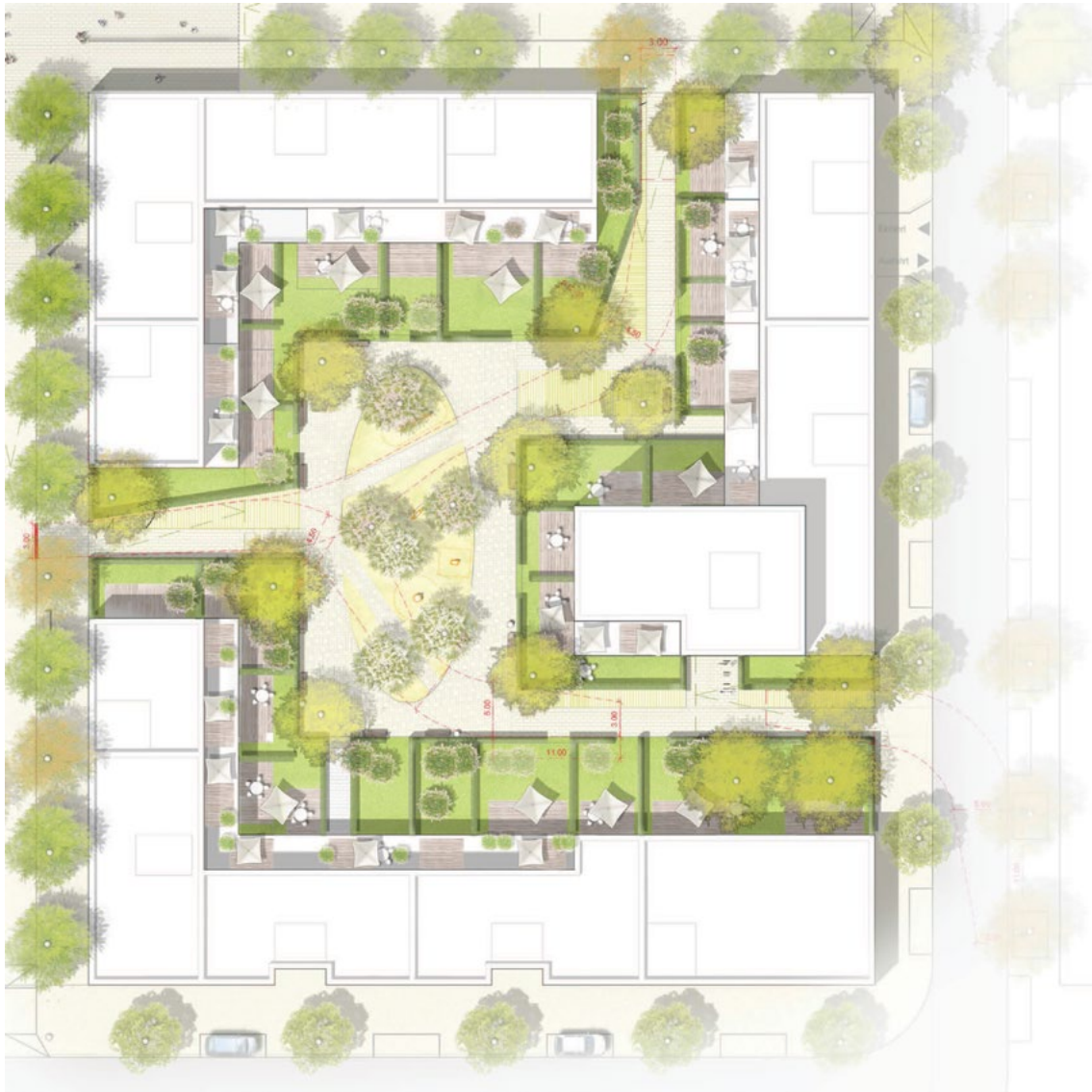
Bilder zum Projekt